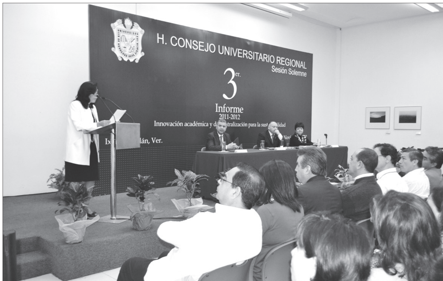
Autoridades que acompañaron a la Vicerrectora

Se refirió a la producción científica lograda entre libros (tres), capítulos (19), reportes técnicos (12) y artículos indexados (34), arbitrados (29) y de divulgación (37), así como a 23 cursos de formación y capacitación académica y administrativa con 400 participantes.