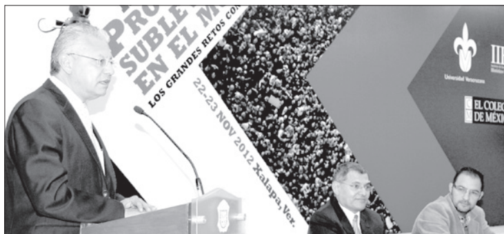
Inauguración del Congreso Internacional Protestas y Sublevaciones en el Mundo