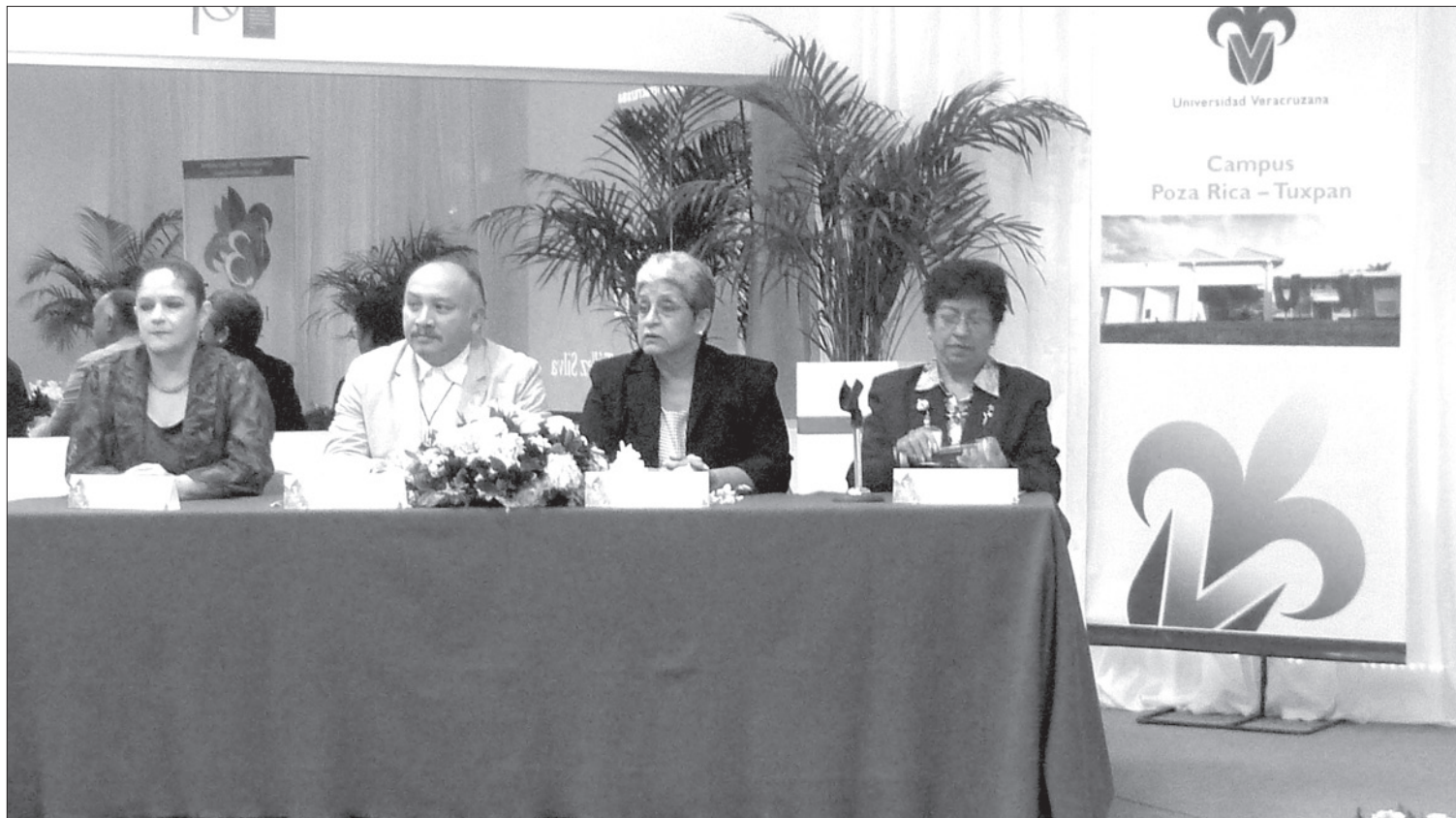
Autoridades que acompañaron a la Vicerrectora

Respecto de la Investigación, manifestó que existen 18 cuerpos académicos, cinco más que el periodo anterior, lo cual muestra que cada vez más maestros