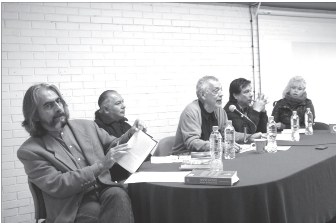
Artistas y académicos dialogaron sobre el cuerpo como objeto del arte

“Yo tengo un solo que le monté a una chica de la compañía, pero esta vez me tocó bailar a mí –hace poco en Morelia– y habla de una pasarela