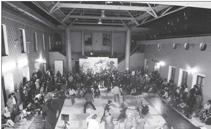
Aspecto de la jam session interdisciplinaria en la Unidad de Artes

Al mismo tiempo, estudiantes de Música y de Jazzuv disponían sus instrumentos en el escenario y detallaban la lista de participantes;