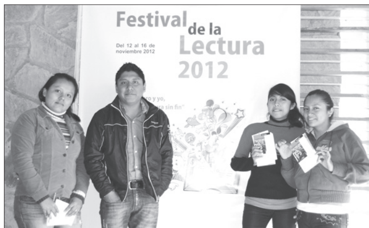
Alumnos de la Huasteca

Para mayores informes, los interesados pueden consultar la página www.uv.mx/uvi .