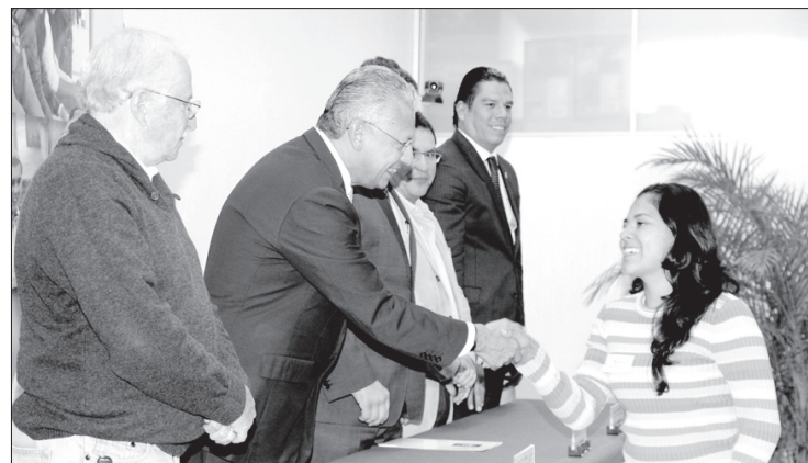
El Rector felicitó a los estudiantes

“Provengo de una familia de escasos recursos y desde chico me he caracterizado por ser un buen estudiante, por mi parte doy clases de música con lo que me ayudo en los gastos; nos hemos visto en situaciones muy difíciles para que tanto mi hermano como yo sigamos