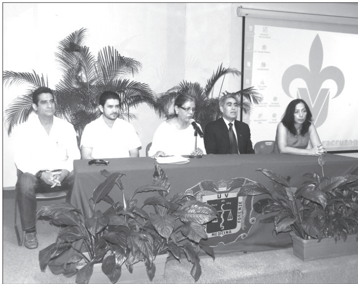
Coincidió en poner las ciencias médicas al servicio de la justicia

El curso estuvo dirigido a estudiantes de las carreras de Técnico Superior Universitario (TSU) Histopatólogo Embalsamador, TSU Histotecnólogo Embalsamador, Medicina, y la Maestría en Medicina Forense, así como a patólogos de la UV e instituciones de la región.