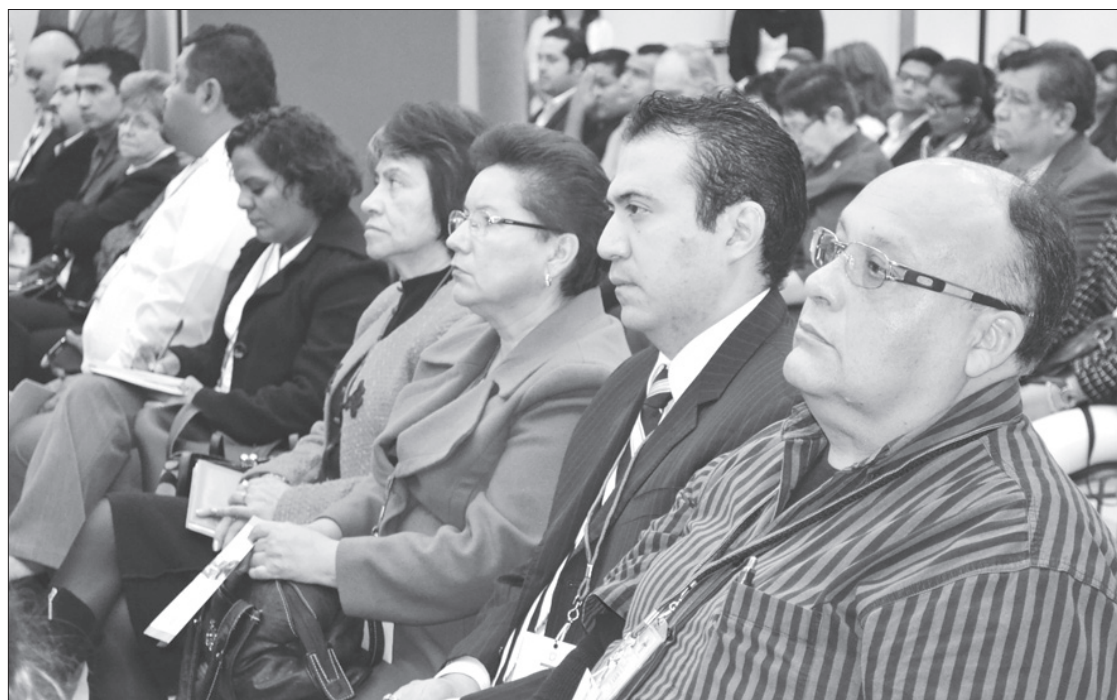
El Consejo Universitario Regional escuchó atento el Informe