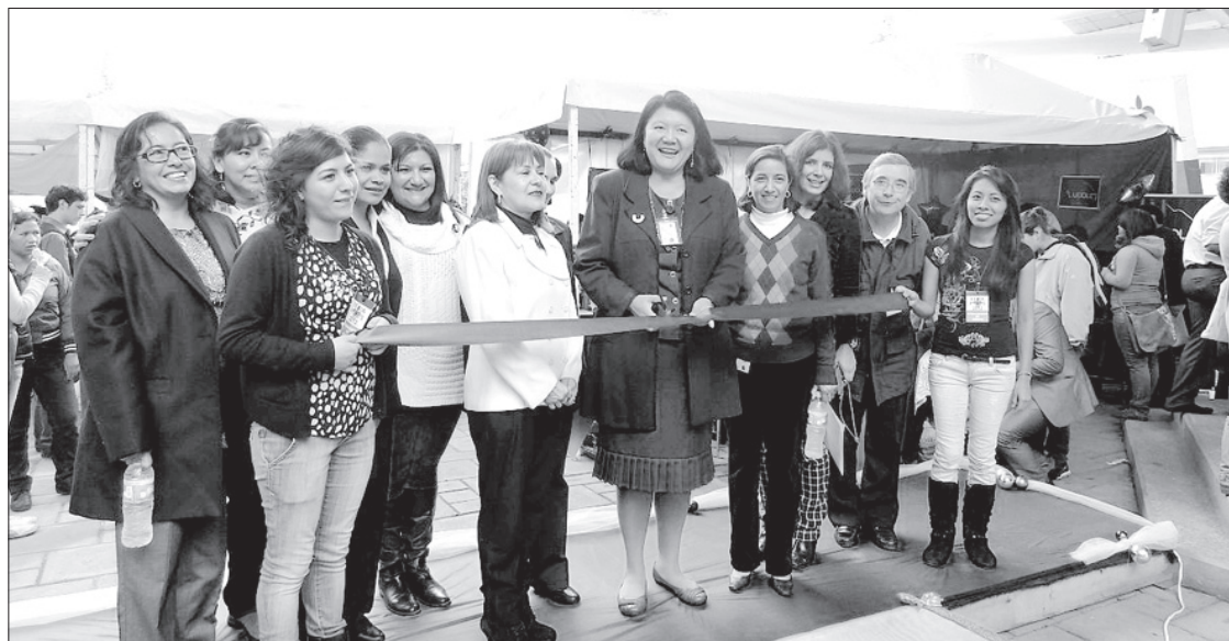
Directiva y alumnos de la FCAS, en la inauguración de la Feria

Los universitarios apoyaron a los productores en la elaboración de un catálogo virtual