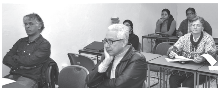
El Primer Coloquio de Avances y Resultados de Investigación de la UVI

Las actividades de la semana giraron en torno a la construcción histórica de este municipio serrano, representada en edificaciones significativas para la cultura local, toda vez que dan fe de la época de prosperidad en la zona.