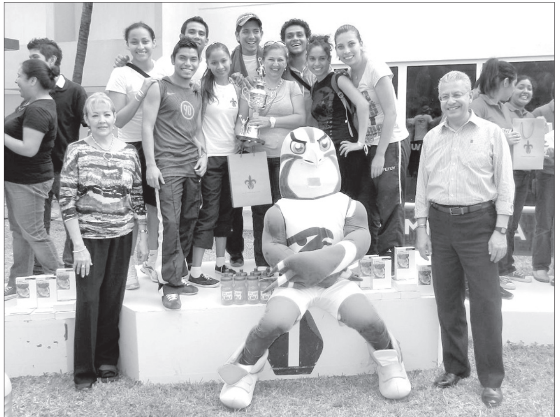
Estudiantes y directivos aplaudieron estas actividades que fomentan la vinculación con su alma máter

A la premiación se sumaron compañeros de otras facultades,