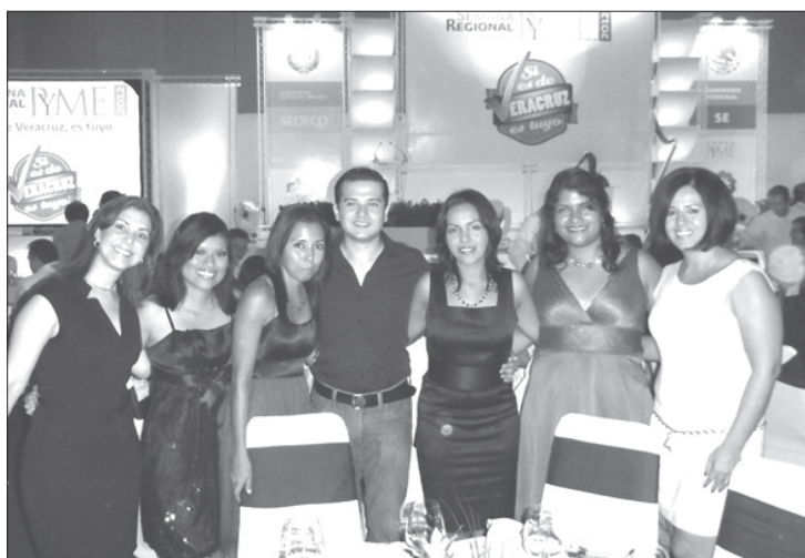
Estudiantes ganadores del tercer lugar

La respuesta por parte de las IES y de los jóvenes emprendedores fue muy positiva, ya que aproximadamente se