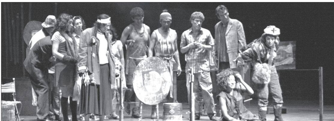
Aspecto de la obra El origen de las especies

El Rector sostuvo que la UV está convencida de que las universidades públicas deben