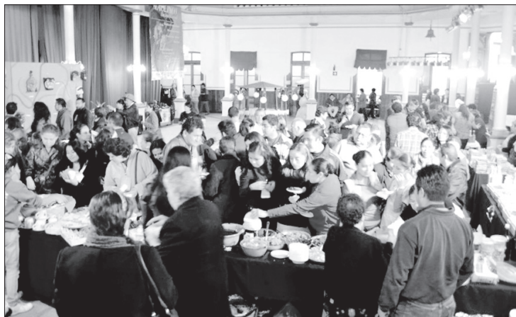
Así lució el evento “Naolinco, una joya encantada”

UV apoyó a empresarios a difundir riqueza patrimonial de Naolinco