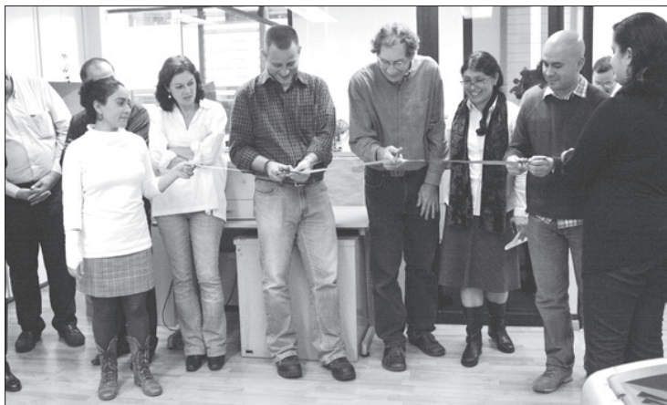
Inauguración de la exposición Fotoestampa 24

“Como ejercicio académico y didáctico, la galería alternativa es de gran valor en un criterio recíproco, los estudiantes pueden tener una respuesta directa del interés que su